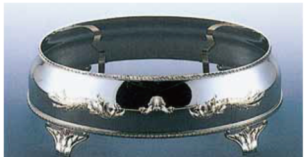
小判皿用かざり台